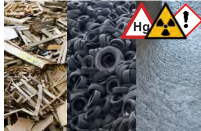
Abfallholz, Klärschlamm, Altreifen