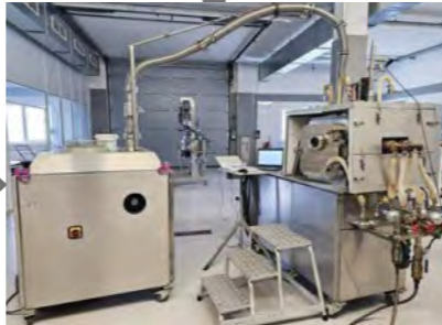
ZETTL Test Center