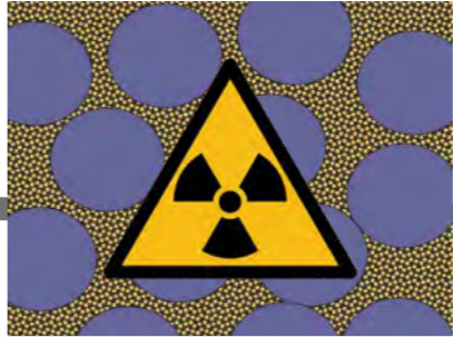
Norm Stabilization Unit